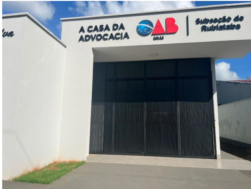
Figura 1-Exemplo de subseção que consta porta metálica (externa) com abertura "camarão".

(62) 3238-2000 www.oabgo.org.br oabnet@oabgo.org.br