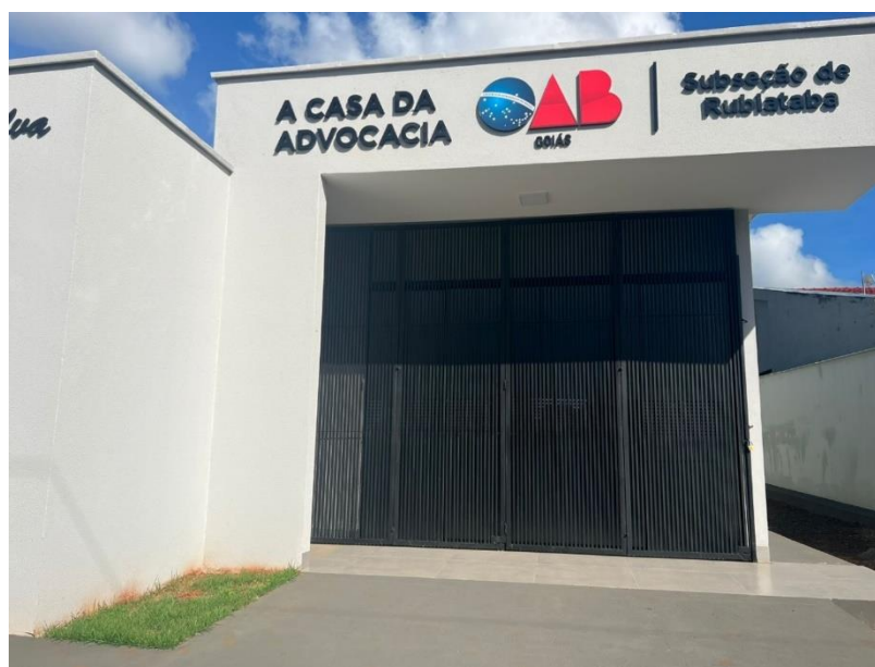
Figura 1-Exemplo de subseção que consta porta metálica (externa) com abertura “camarão”.