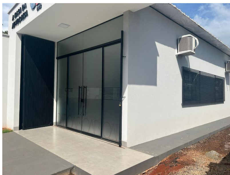
Figura 2 - Exemplo de subseção que consta brisa nas janelas e porta metálica “camarão” recuada.