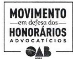
TABELA DE HONORÁRIOS

Ordem dos Advogados do Brasil - Seção de Goiás "Casa do Advogado Jorge Jungmann"