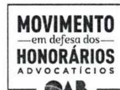
TABELA DE HONORÁRIOS

Ordem dos Advogados do Brasil - Seção de Goiás "Casa do Advogado Jorge Jungmann"