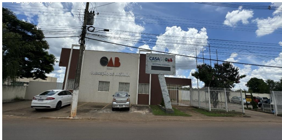
Figura 2 – Foto da fachada existente.