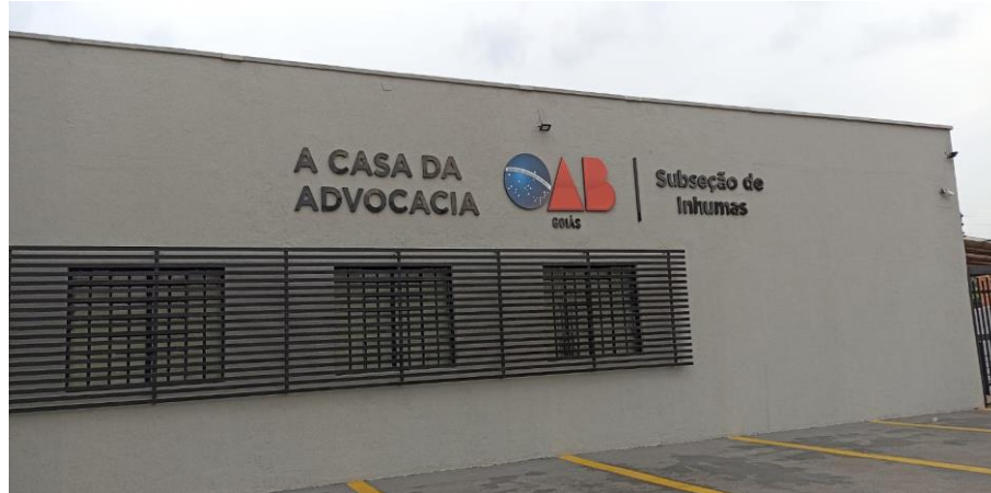
Figura 1 – Exemplo de subseção com brise nas janelas.

☎ (62) 3238-2000 | 🌐 www.oabgo.org.br | ✉ oabnet@oabgo.org.br