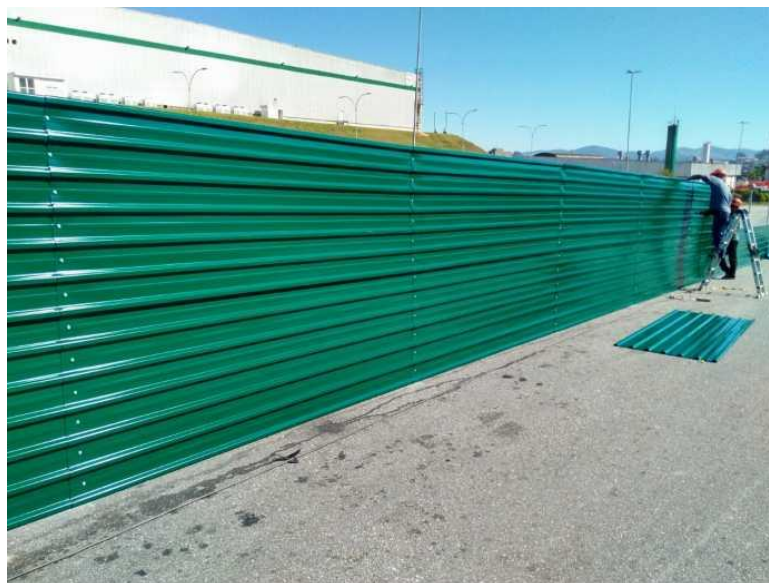
Figura 1 – Modelo de tapume metálico.